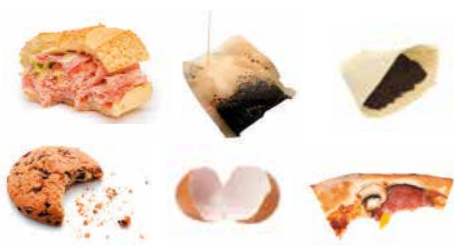
Déchets de cuisine

30% de biodéchets dans nos poubelles peuvent être valorisés en compost.