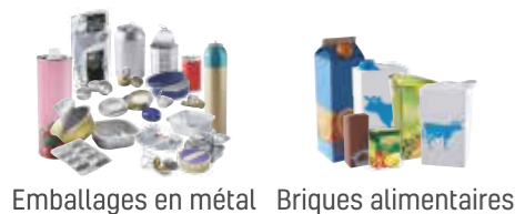
Emballages en métal Briques alimentaires